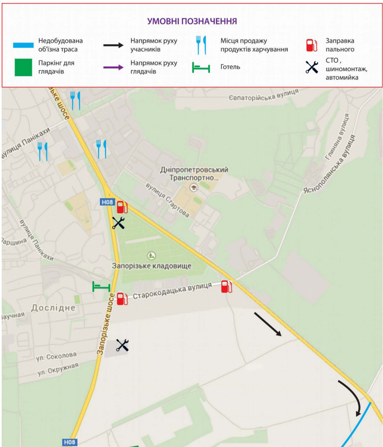
Додаток 2. План місцевості, з вказуванням розміщення траси, інших установ.